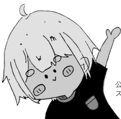
公式キャラクター スポットくん

e-kanagawaは神奈川県システムですが 利用方法等については 寒川町内においても各施設で異なります。 支払期限や予約分の取り扱い等ご注意ください。